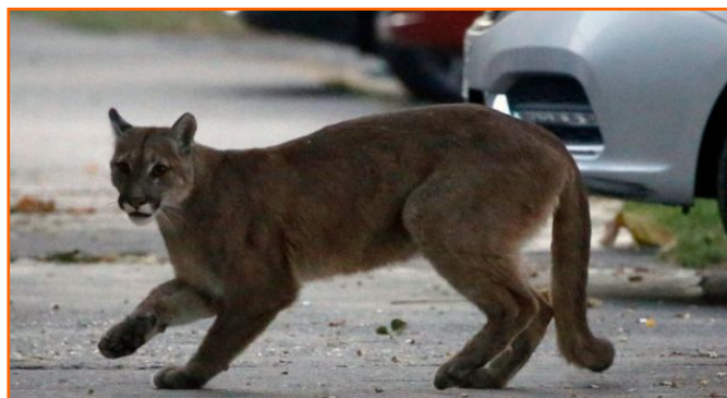
Figura 2. Puma en Santiago de Chile. 2020. https://www.bbc.com/mundo/noticias-52216020

Durante el confinamiento en 2020, las redes sociales y las televisiones públicas y privadas presentaron un imaginario de inspiración mítica de la pandemia en el que las calles vacías de humanos remitían tanto a un infierno posapocalíptico como a un Edén perdido primigenio y recuperado por la naturaleza. Así, la idea del humano como amenaza para la supervivencia del planeta que se ha consolidado desde los debates en torno al antropoceno se ilustra con imágenes de un supuesto avance de la naturaleza y un repliegue de la contaminación.