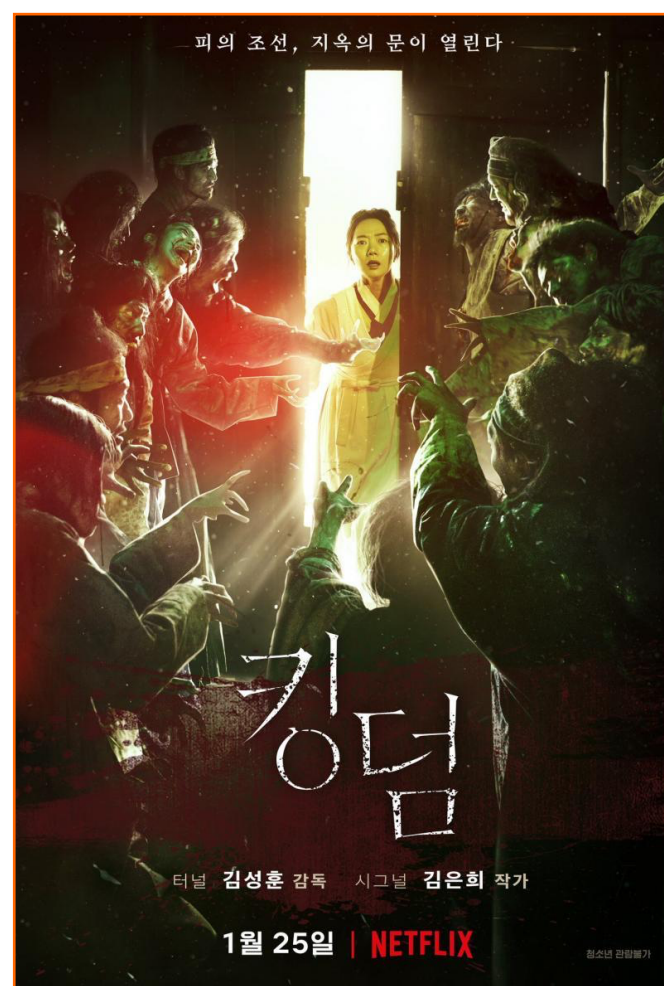
Figura 1. Kim Seong-hoon, Park In-je. Cartel promocional de “Kingdom”. 2019. https://www.netflix.com/title/80180171

El SARS-CoV-2 surge como una amenaza con terribles consecuencias para la salud pública y la economía global. Este virus zombi , entre lo vivo y no vivo, como una figura más que puebla la literatura y la producción visual en forma de imaginario apocalíptico, se presenta en las películas y series de zombis de las plataformas de entretenimiento (Netflix, HBO), como la surcoreana Kingdom (2019), conviviendo con películas sobre pandemias víricas que amenazan con ser el fin de la especie humana en el antropoceno: Contagion (2011).